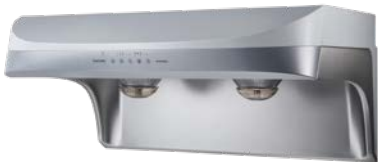
流線型渦輪變頻除油煙機