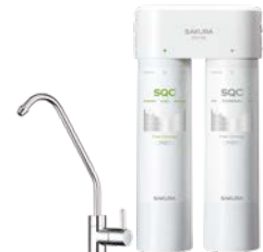
快捷高效淨水器 (雙管除菌型)