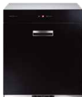
Q7690 全平面玻璃觸控 落地式烘碗機