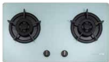
G2522AG 二口小面板 易清檯面爐