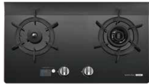
G2926G 智能雙炫火檯面爐